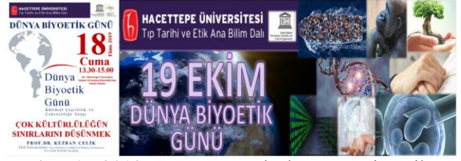
Resim 1: 2019 UNESCO Uluslararası Biyoetik Ağı Türkiye Birimi, 2019 Dünya Biyoetik Günü Kutlaması Afışı

ardından katılımcılar ile verimli tartışmalar yapılmış, biyoetik alanında multidisipliner işbirliği ve coşkunun pekiştirilmesi sağlanmıştır.